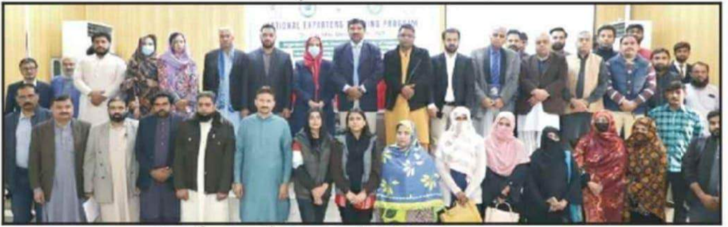
ڈیرہ غازیخان: غازی یونیورسٹی میں فائنل اسٹس بارے تربیتی پروگرام کے شرکاء کا گروپ فوٹو

شیخ طاہر معراج ڈسٹرکٹ رپورٹر روزنامہ سفیر پنجاب ملتان ڈیرہ غازیخان 03361315050