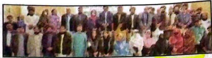
ڈیرہ غازیخان: غازی یونیورسٹی میں نیشنل ایکسپورٹرز پروگرام کے شرکاء کا گروپ فوٹو