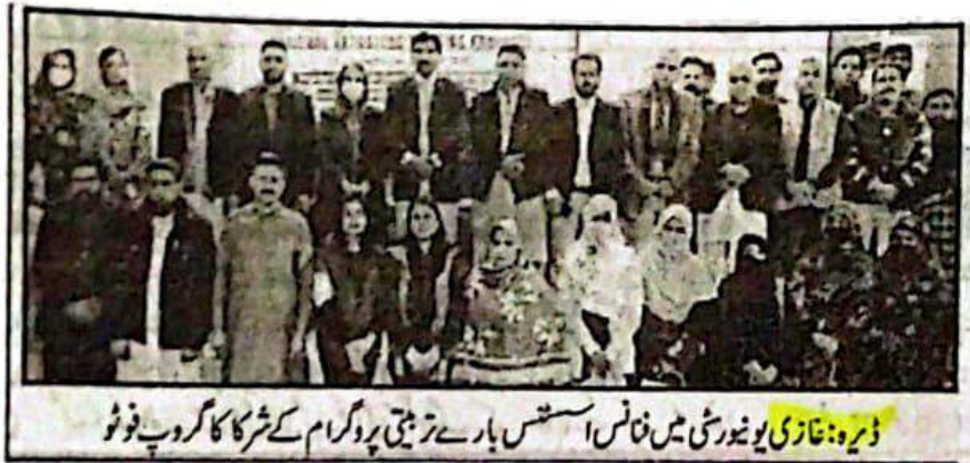
ڈیرہ: غازی یونیورسٹی میں فنانس اسٹینڈس بار سے تربیتی پروگرام کے شرکا کا گروپ فوٹو

جلد 19 جمعہ المبارک 8 جمادی الثانی 1445ھ 22 دسمبر 2023ء 8 پوہ 2078 ب صفات 8 قیمت 30 روپے شماره 335 فنانس مینجمنٹ کیشن ممبرز کا چیف ایگنیشن کمشنر پر اظہار اعتماد کے پی بار کونسل کا صوبے میں سیشنوں میں کمی کا بیان کسے بنیاد قرار