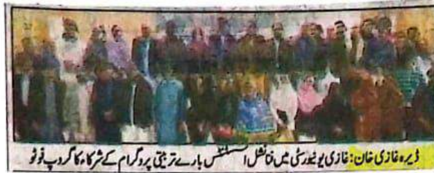
ڈیرہ غازی خان: غازی یونیورسٹی میں فن ناضل اسٹینس بارے ترینی پروگرام کے شرکاء کا گروپ فوٹو