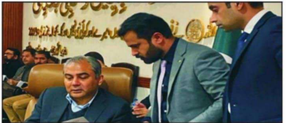
چیف سیکرٹری، انسپکٹر جنرل پولیس اور متعلقہ سیکرٹریز محسن نقوی سے ہدایات لیتے ہوئے

30 لے ہوئے ہو کر ذرا اعلیٰ محسن نقوی کی ہے متعلقہ سیکرٹریز کی زیر صدارت وزیر اعلیٰ آفس میں پنجاب چیمبرز آف کامرس کو آرڈینیشن کمیٹی کا تیسرا اجلاس منعقد ہوا پنجاب کی تمام کابینہ، ڈیرہ غازیخان (بیورو رپورٹ) وزیر اعلیٰ پنجاب محسن نقوی کی زیر صدارت وزیر اعلیٰ آفس میں پنجاب چیمبرز آف کامرس کو آرڈینیشن کمیٹی کا تیسرا اجلاس منعقد ہوا پنجاب کی تمام کابینہ،