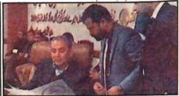
وزیر اعلیٰ حسن نقوی کو ڈیرہ جمیر آف کامرس کے عہدہ دار مرزا ظفر اقبال - سفارشات پیش کرتے ہوئے

سے مستفید ہوتے ہوئے اپنی تعلیمی سرگرمیوں کو چھوڑ کر سہولیات کے ساتھ تجارتی کر کے ملک و قوم کا نام روشن کریں بعد ازاں منگلواروں اور تاجر برادری کے صدور اور عہدہ داران نے کاروبار کے فروغ کے لئے تہاؤں اور سفارشات پیش کیں وزیر اعلیٰ حسن نقوی نے تہاؤں پر کھوت کر کے قابل عمل تہاؤں پر ملحد آمد کی یقین دہانی کرائی اجلاس سے خطاب کرتے ہوئے وزیر اعلیٰ حسن نقوی نے کہا کہ تاجر اور صنعتکاروں کی سہولت کی بہتری کے لئے قابل عمل کردار ادا کر سکتے ہیں اور مکران پورے ملک کے لئے واپس ستر قائم کرنے کا جائزہ میں گے پنجاب کے ہر ڈیپن میں پرنس پیپلیٹیشن ستر قائم کئے جا رہے ہیں جبکہ 45 دن میں 6 پرنس پیپلیٹیشن ستر قائم کر کے مکمل کر دیے ہیں وزیر اعلیٰ حسن نقوی نے کہا کہ پرنس پیپلیٹیشن ستر پر 22 صوبائی حکاموں اور 2 وفاقی حکاموں کے کاؤنڈنڈات فراہم کر رہے ہیں پرنس پیپلیٹیشن ستر کے قیام سے صنعتکاروں کو 124 این ایس ایک پیسٹ سے بھر ہوں گے۔