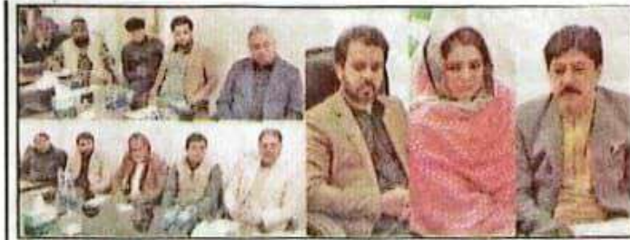
جنگ ڈائریکٹر پنجاب سال انڈسٹریز صدرہ یونس ڈیرہ چیئرمین اجلاس کی صدارت کر رہی ہیں